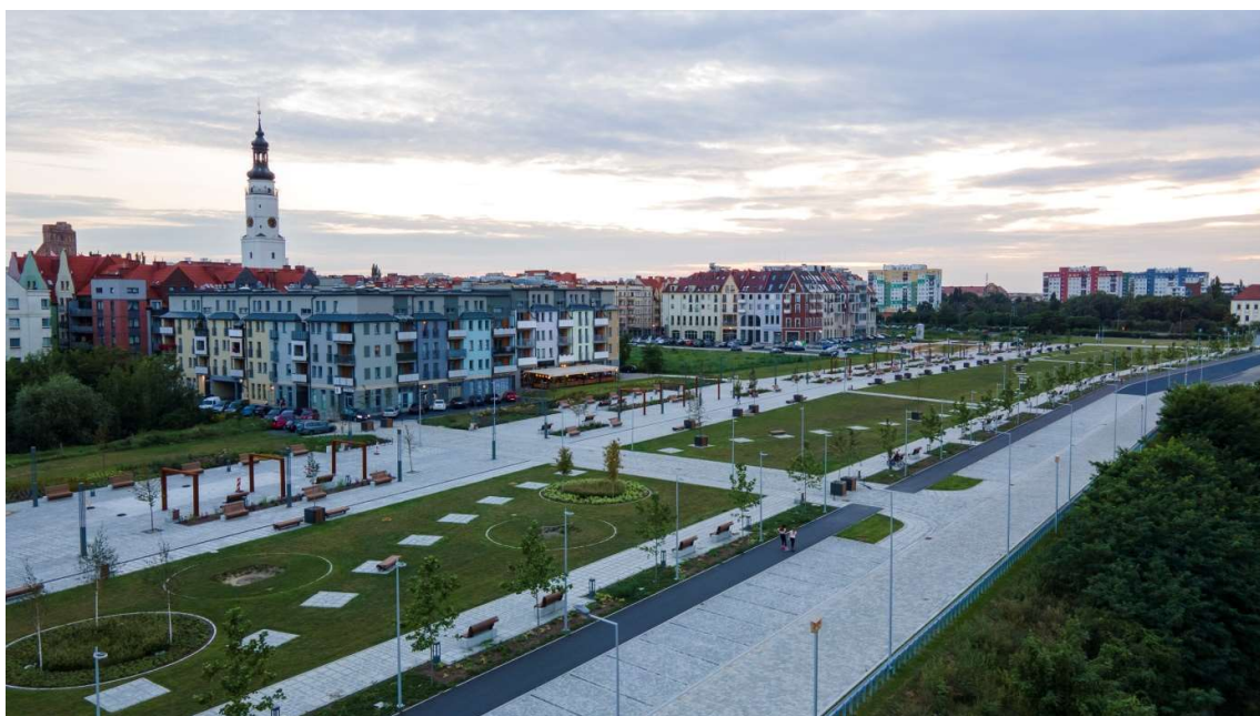
Bulwar nadodrzański- po realizacji; źródło: Biuro Polityki Gospodarczej Urzędu Miejskiego w Głogowie, STUDIO SIWEK