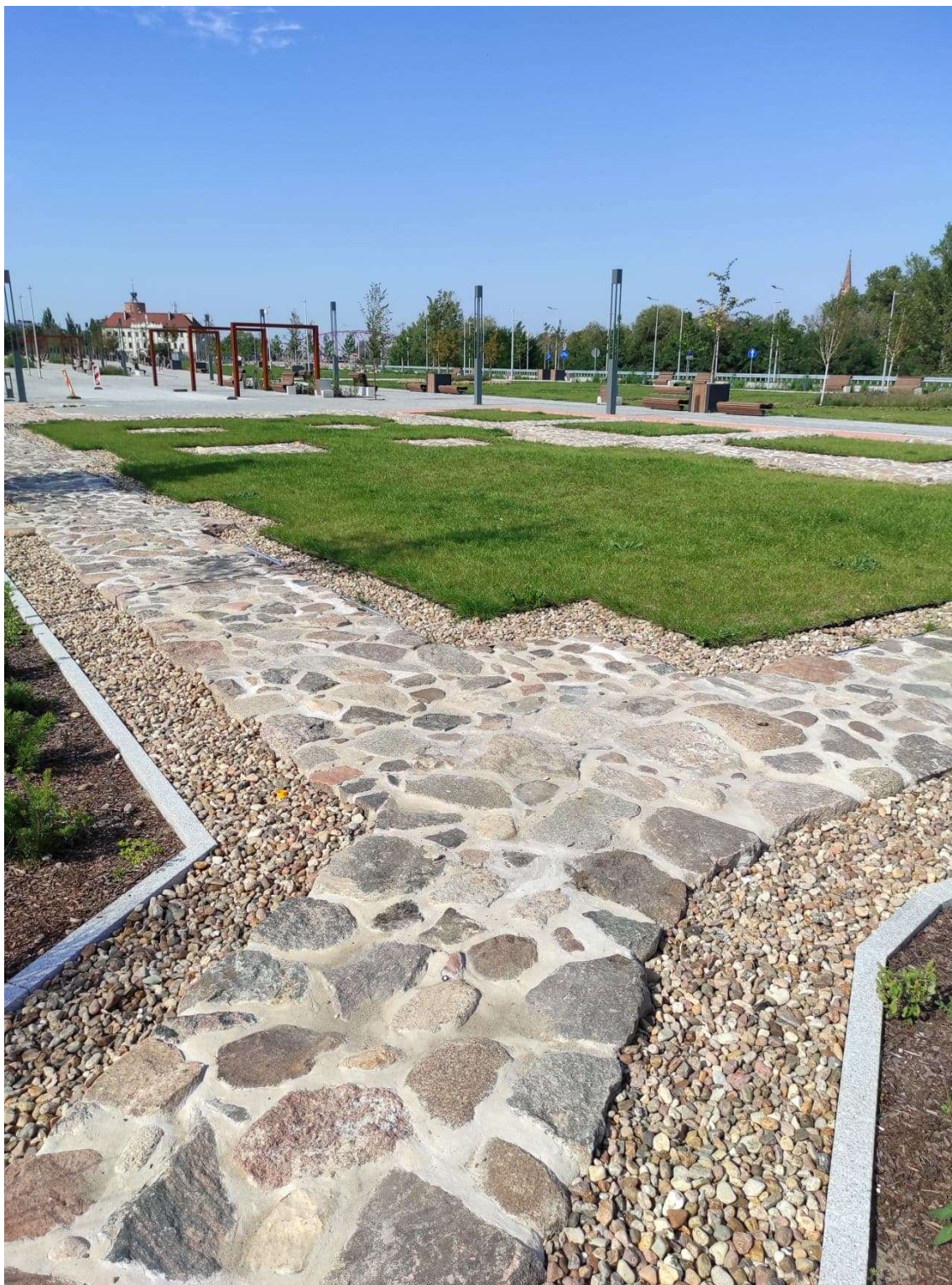
Bulwar nadodrzański- po realizacji- wyniesiony rys kościoła św. Krzyża