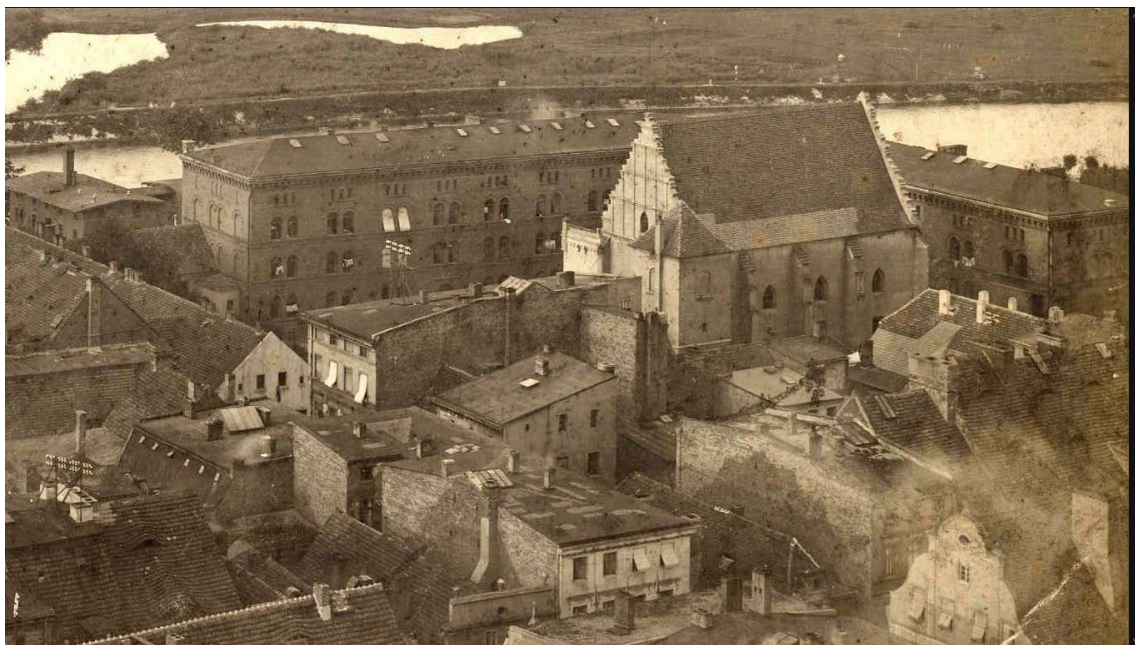
Głogów (Glogau) przed II Wojną Światową- teren aktualnego bulwaru (kościół św. Krzyża)