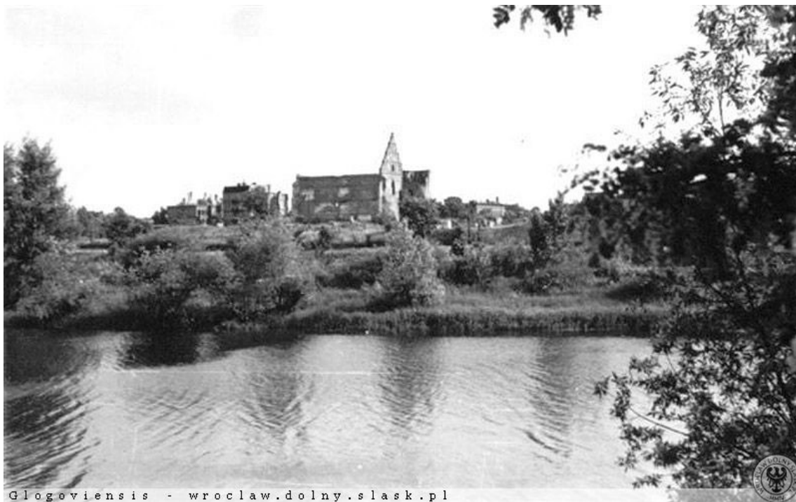
Zniszczenia wojenne- w tle ruiny kościoła św. Krzyża; źródło: www.glogow.pl